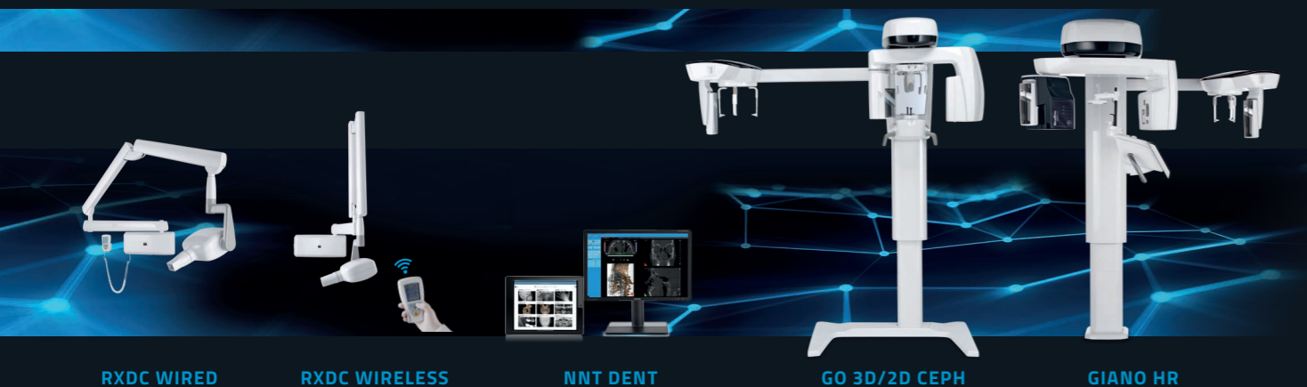
RXDC WIRED RXDC WIRELESS NNT DENT GO 3D/2D CEPH GIANO HR

Per semplificare al massimo l'utilizzo della piattaforma DENTALDOSE con i dispositivi NewTom è necessario la versione NNT 14 o superiore, che richiede il sistema operativo Windows 10 o superiore.