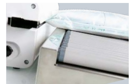
TRANSPORTADOR DE RODILLOS