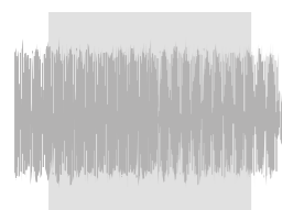
Livello acustico turbina convenzionale