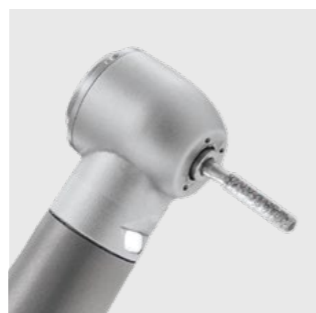
EVO miniature K