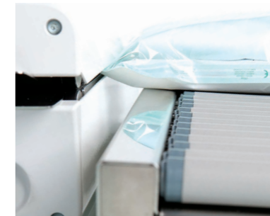
Transportador de rodillos